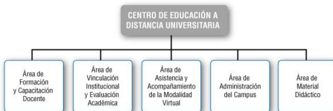
Figura 1: Áreas de trabajo del CEDU

A partir de la creación del Ministerio de Seguridad de la Nación en el año 2010 (DE MS N° 1993/2010), se avanzó en una serie de numerosas modificaciones para las Fuerzas Policiales y de Seguridad (FFPPySS), y en particular para el IUPFA. Apoyándose en el Informe de Evaluación Externa realizado por la CONEAU, en el año 2007 se inició un proceso de reforma institucional que se tradujo en el Estatuto del IUPFA (RES ME N° 1363/2012). En el año 2012 el CEDU pasó a depender de la Secretaría Académica del IUPFA (RES REC N° 568/2012), y se aprobó en 2013 su estructura orgánica funcional (DISP SA N° 1180/2013), quedando compuesta por cinco (5) áreas de trabajo (Ver Figura 1):